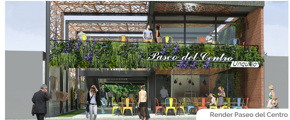
Render Paseo del Centro