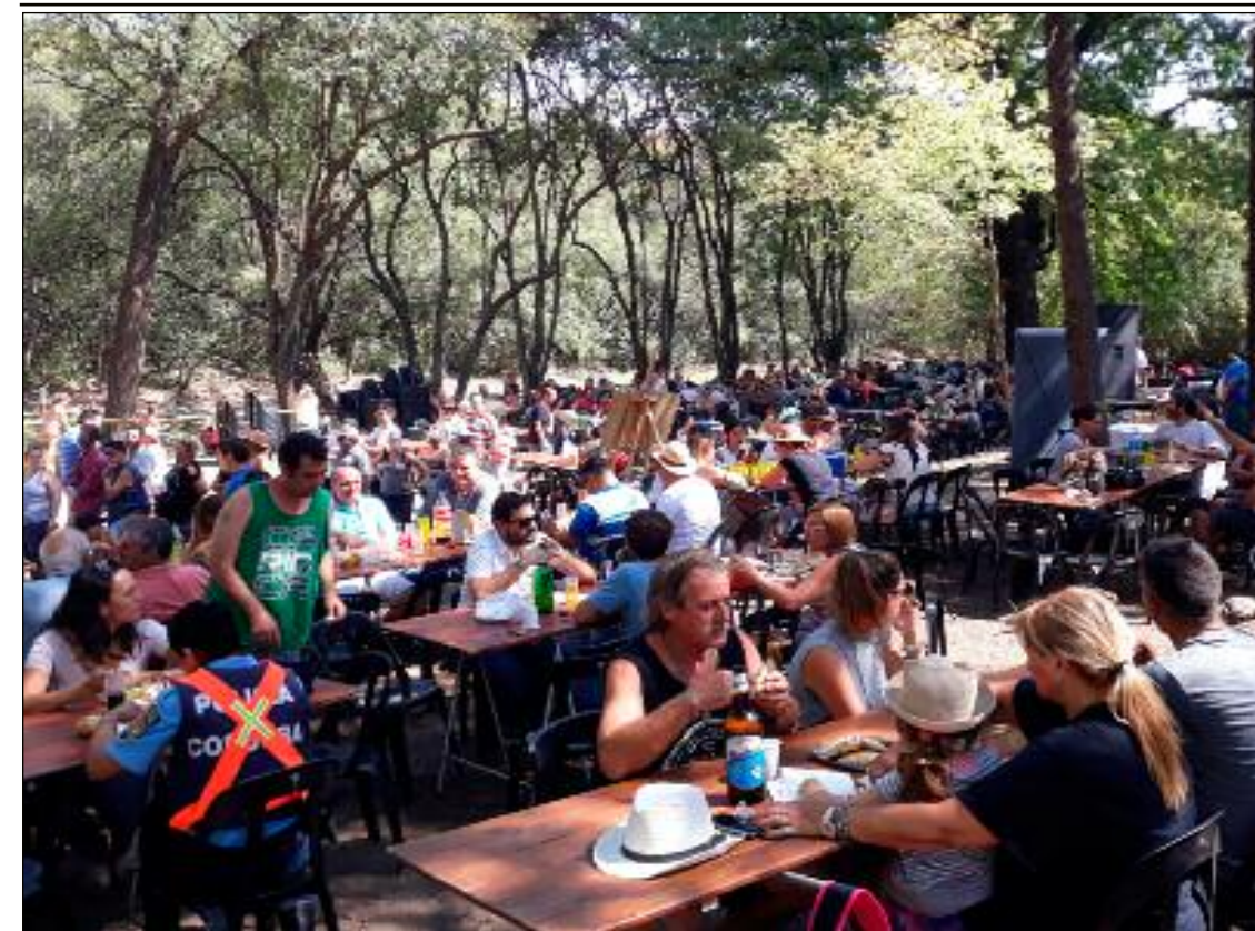
Hubo que improvisar tabloneros para atender a todos los visitantes.

MENDIOLA MALL. Av. Intermunicipal Km 9.5 Mendiola. Tel: 3543-435467 / 3543-310666 centromedicosalvus@gmail.com