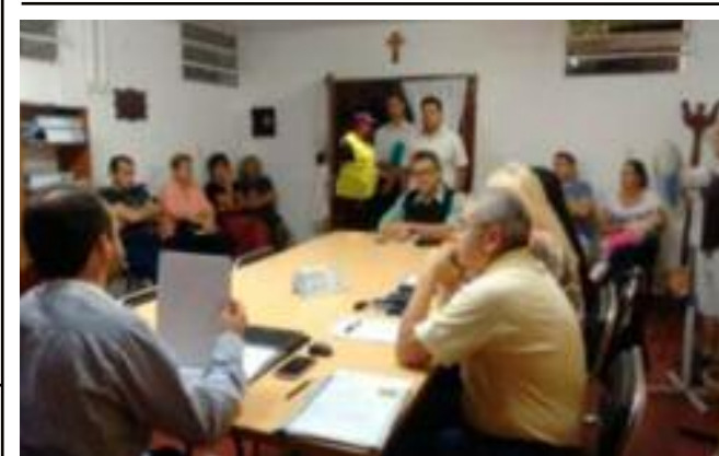
PREVENCIÓN DE CATÁSTROFES

Esta decisión surge luego de una nueva reunión mantenida el jueves 5 de abril, convocada por el Gobierno Provincial en la sede del Centro Cívico, donde no se pudo avanzar con los reclamos por coparticipación que el Consenso Fiscal, mantienen los intendentes de Cambio, por la negativa de apertura al diálogo por parte de la Provincia-Municipios. En el desarrollo del encuentro se extendió por unos 40 minutos y, en relación al tema coparticipación, el ministro Giordano ratificó la postura de no coparticipar con los reclamos que ingresan a la provincia por coparticipación que el Consenso Fiscal, argumentando que no corresponde por ley. Los radicales analizaron de irse de la Mesa Provincia-Municipios.