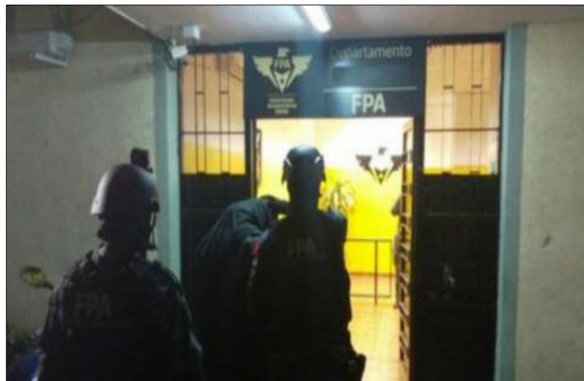
La detención de los presuntos dealers

Tres sujetos de 20, 21 y 33 años, que según investigaciones -coordinadas por el Ministerio Público Fiscal- dirigían un punto de venta de estupefacientes en la ciudad de Colonia Caroya, fueron detenidos por efectivos de la Fuerza Policial Antinarco tráfico. El procedimiento tuvo lugar en una vivienda ubicada en calle 126 de barrio Malabrigo, la cual disponía en las inmediaciones de un espacio con árboles, habitualmente utilizado por eventuales compradores para consumir las sustancias adquiridas en el lugar. Ante la rápida irrupción de un equipo táctico de la Fuerza, los investigados fueron "sorprendidos con varias dosis de cocaína y marihuana" -aparentemente preparadas para ser comercializadas-. En el lugar, además se se-