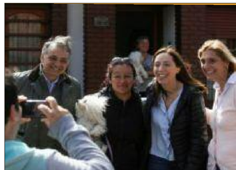
Votando imágenes, más que ideas

APU: ¿Existe algún tipo de legislación al respecto? EM: Lo más parecido a una legislación es la Ley de protección de datos personales, que establece que los datos que uno entrega solo pueden ser usados para aquello para lo que uno los entrega. No soy un experto en el tema, pero eso evidentemente se está violando. ¿Cómo hacemos para aplicar esa ley a Facebook? Que después nos hace firmar con-