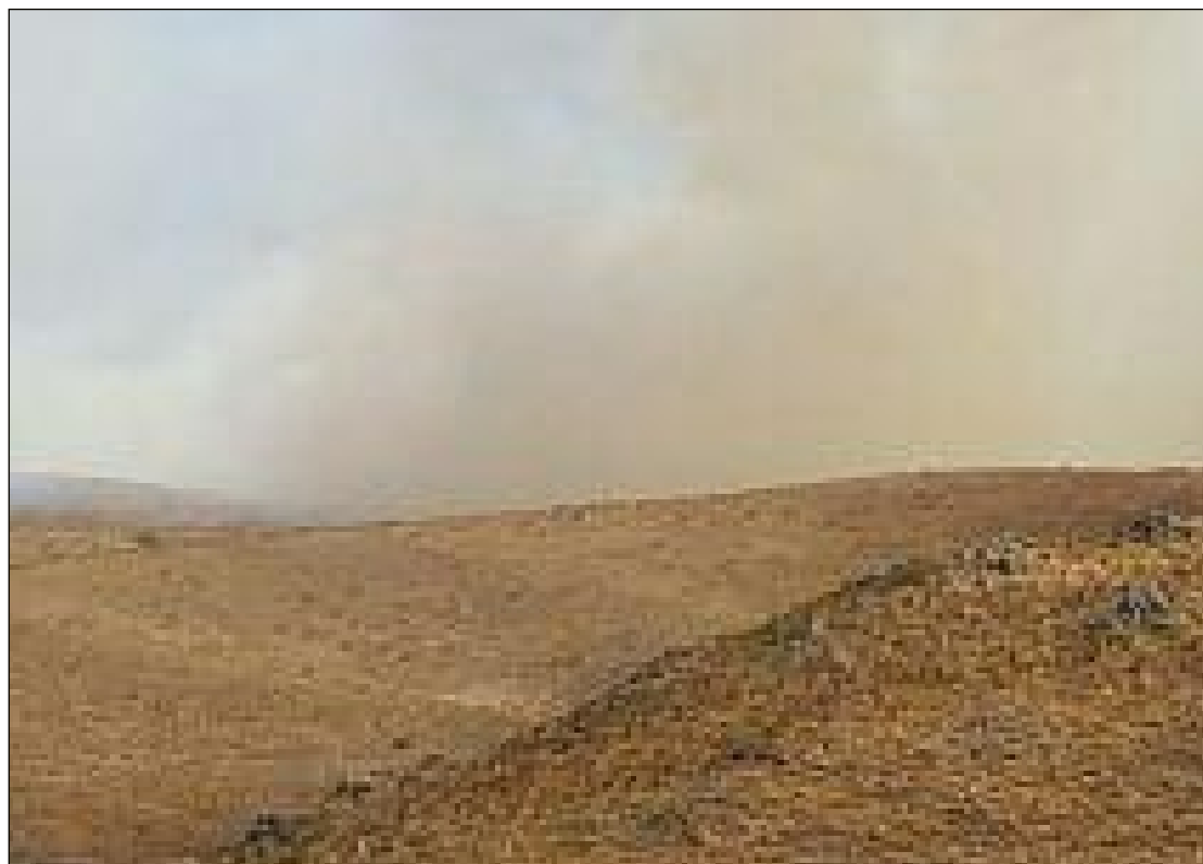
Los incendios, una constante en la zona