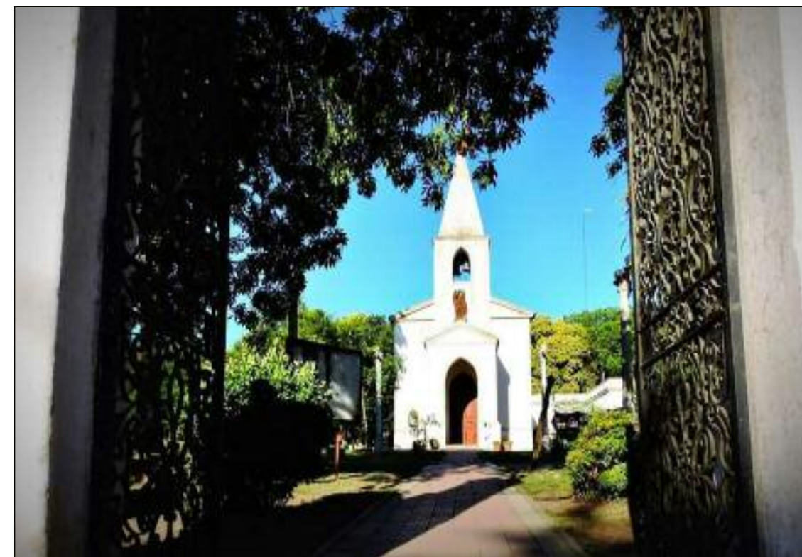
uno de los encantos de la región, la iglesia de Salsipuedes