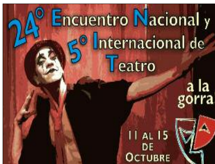
El afiche promocional del Festival

APU: ¿El uso del "Big Data" por parte de las empresas y organismos públicos, restringe nuestra libertad de consumo? EM: El uso de Big Data no es que restrinja nuestra libertad de consumo, primero habría que definir libertad: en base a qué decide uno. Lo que hace es sesgar una parte de la realidad, o recortar la realidad, adaptándola a nuestra zona de confort. Facebook nos muestra cosas que nos interesan, porque sabe quiénes somos, qué nos gusta. De esa manera nos muestra aquello que nos interesa, y de alguna manera nos va empujando a ciertos comportamientos que son funcionales a sus intereses económicos. No sé si eso es coartar la libertad, siempre la realidad ha recortado nuestra libertad en base a lo que nosotros vemos. El mundo digital es manipulable 100 x 100.