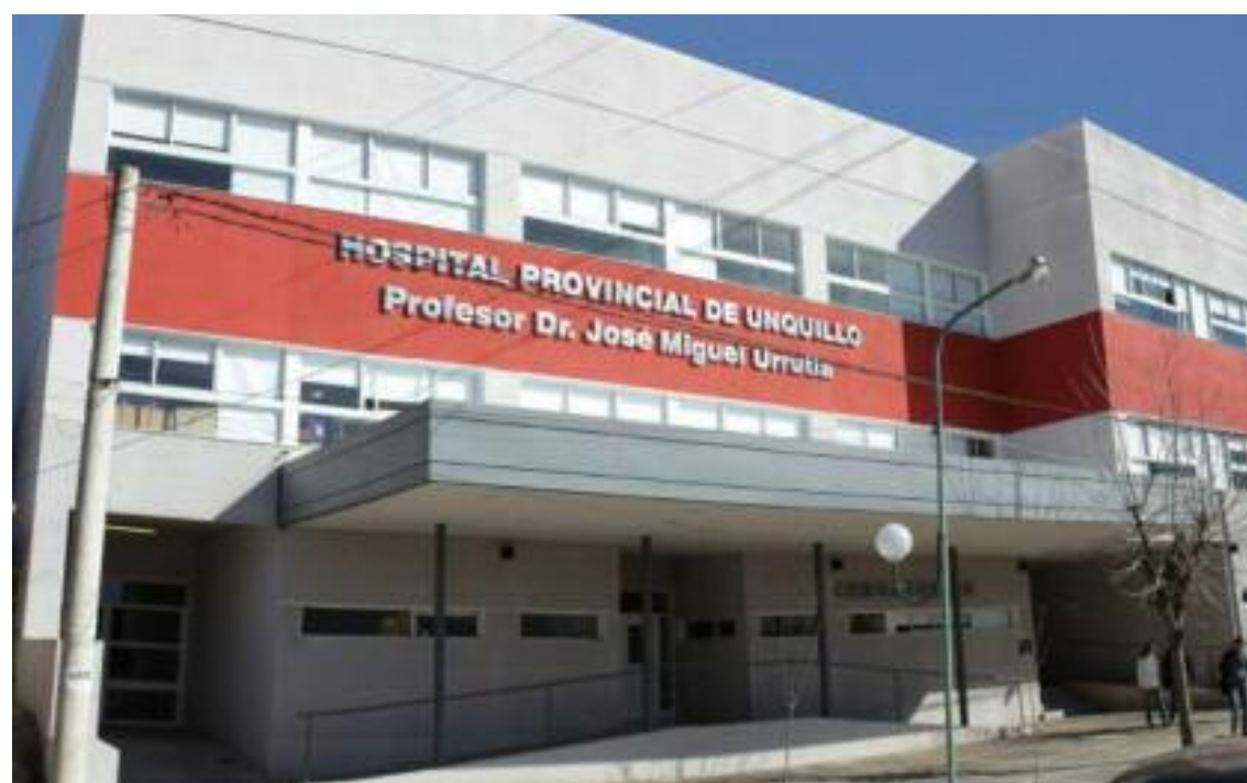
PESE A LA AMPLIACIÓN, SIGUEN LAS PROTESTAS

Una madre y su hijo resultaron con lesiones al colisionar la motocicleta en la que se conducían el viernes 3 de Noviembre. Ese mismo titular se repite con variaciones de edad y género casi todos los días del año en esa localidad del Departamento Colón. Los partes policiales revelan datos casi calcados de distintas arterias caroyenses donde los choques entre motociclistas y automóviles son moneda corriente y no se perciben proyectos para ordenar el tránsito de alguna forma. Ya se han registrado inclusive numerosos accidentes fatales que se podrían evitar con campañas de concientización y medidas por parte del municipio en el sentido de la prevención y señalización adecuadas.