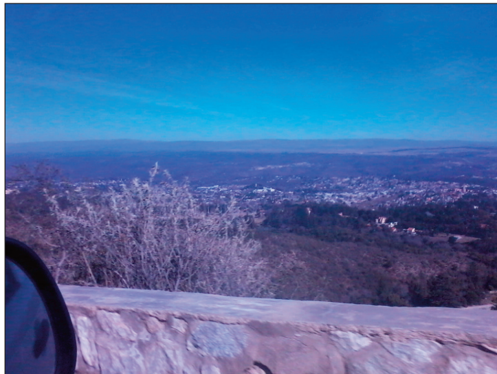
Recorriendo el Camino al Cuadrado